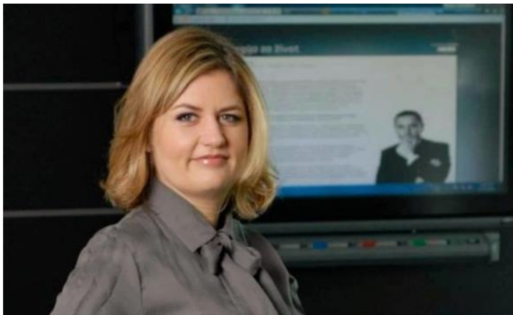
Сања Божиновска - министерка за енергетика, рударство и минерални сировини ( /Home/PostDetails?PostId=592294 )