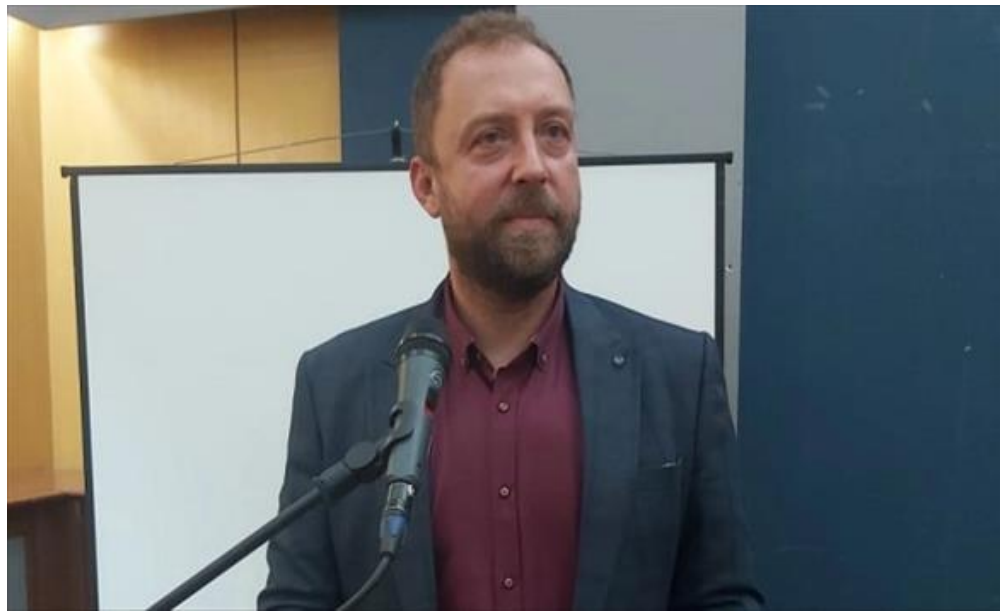
Зоран Љутков - министер за култура и туризам (/Home/PostDetails?PostId=592298)