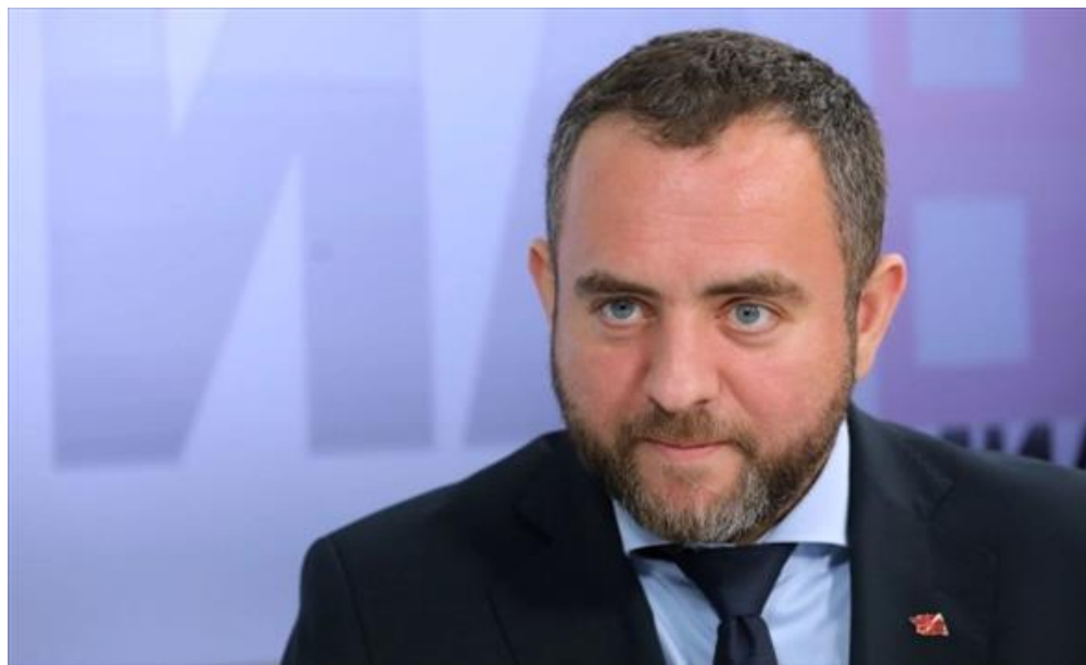
Панче Тошковски - министер за внатрешни работи (/Home/PostDetails?PostId=592303)