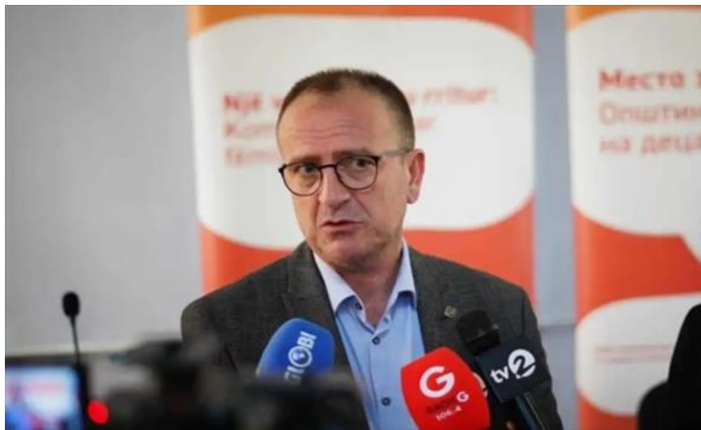
Арбен Таравари - министер за здравство (/Home/PostDetails?PostId=592296)