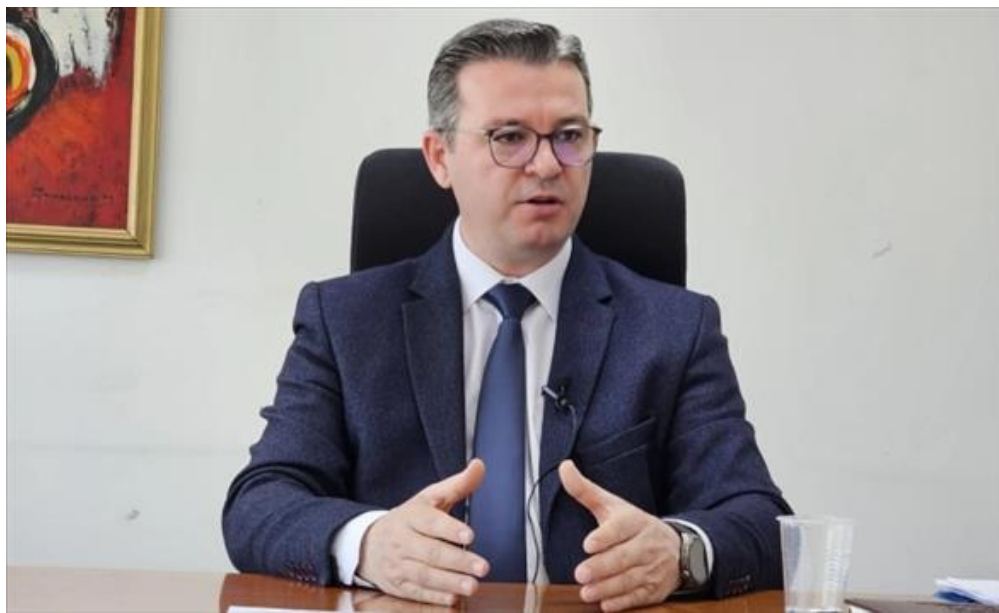
Цветан Трипуновски - министер за земјоделство, шумарство и водостопанство ( /Home/PostDetails?PostId=592293 )