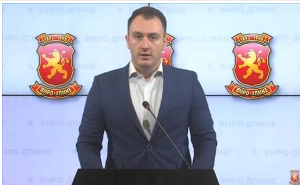
Стефан Андоновски - министер за информатичко општество и дигитална трансформација (/Home/PostDetails?PostId=592295)