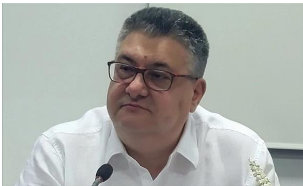
Горан Минчев - министер за јавна администрација (/Home/PostDetails?PostId=592297)