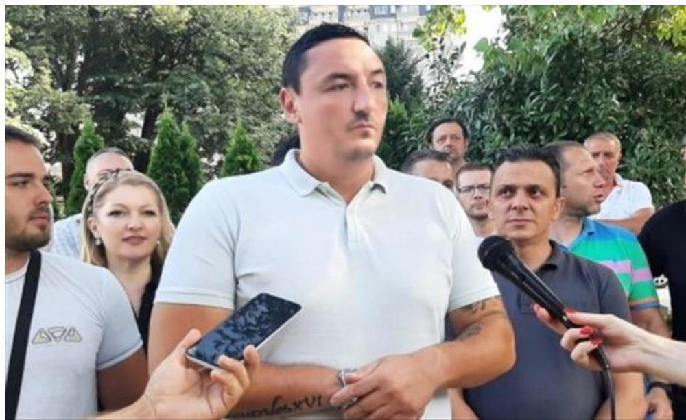
Борко Ристовски - министер за спорт (/Home/PostDetails?PostId=592300)