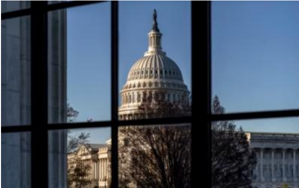
Бугарската дијаспора против Резолуцијата на ОМД во американскиот Сенат