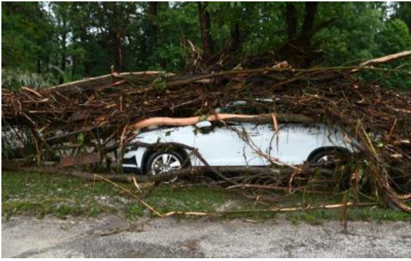
Најлошите поплави во историјата на Словенија убија шест луѓе: „Штетата е неколку...