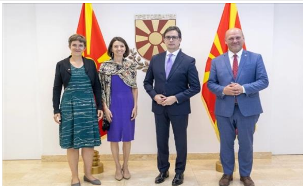
Пендаровски оствари средба со „Вајмарската тројка“ (/Home/PostDetails?PostId=547537)