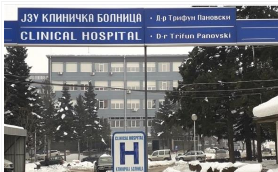
Меџити иницираше вонреден надзор во Клиничката болница Битола (/Home/PostDetails?PostId=547526)