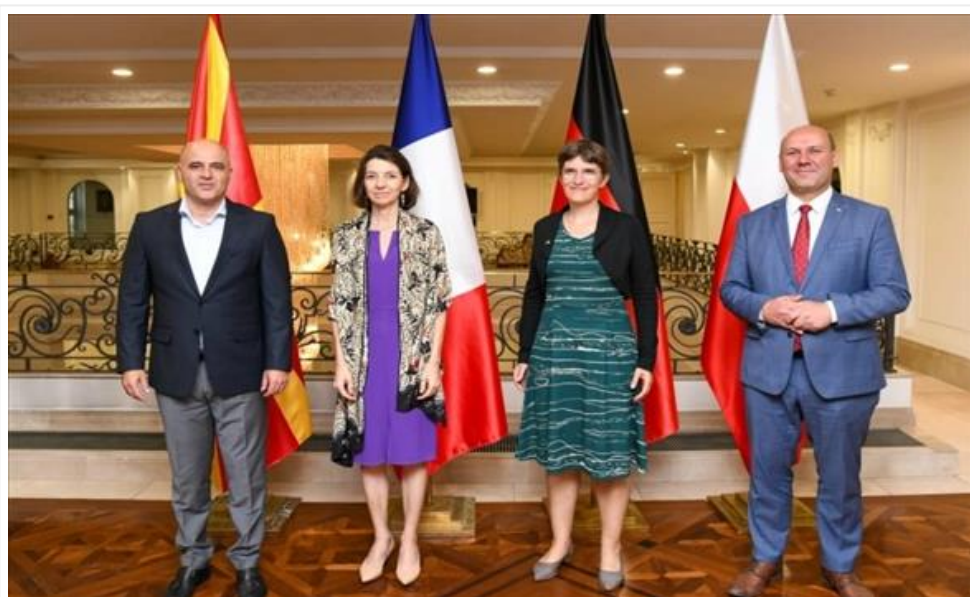
Ковачевски - Вајмарска тројка: Силна поддршка од Германија, Франција и Полска (/Home/PostDetails?PostId=547536)