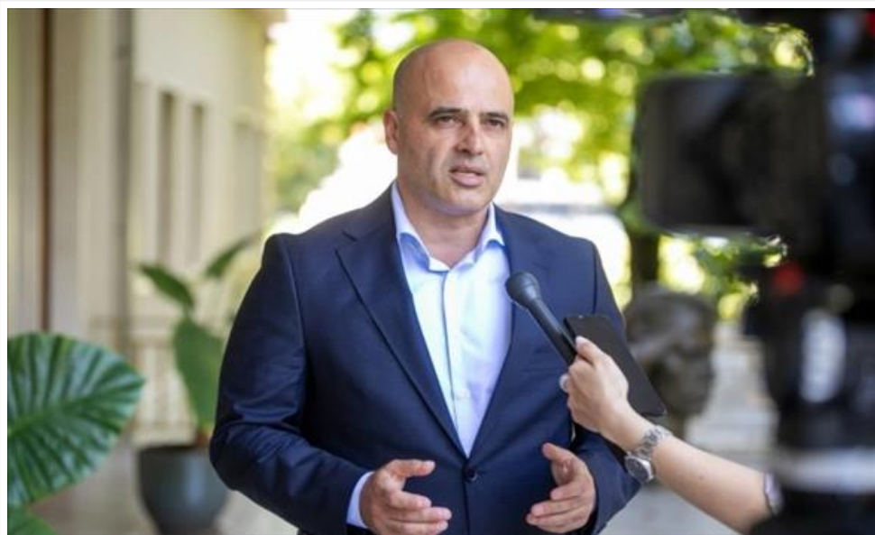
Ковачевски од Тирана: Ја унапредуваме соработката во Западен Балкан, на патот кон ЕУ (/Home/PostDetails?PostId=547527)