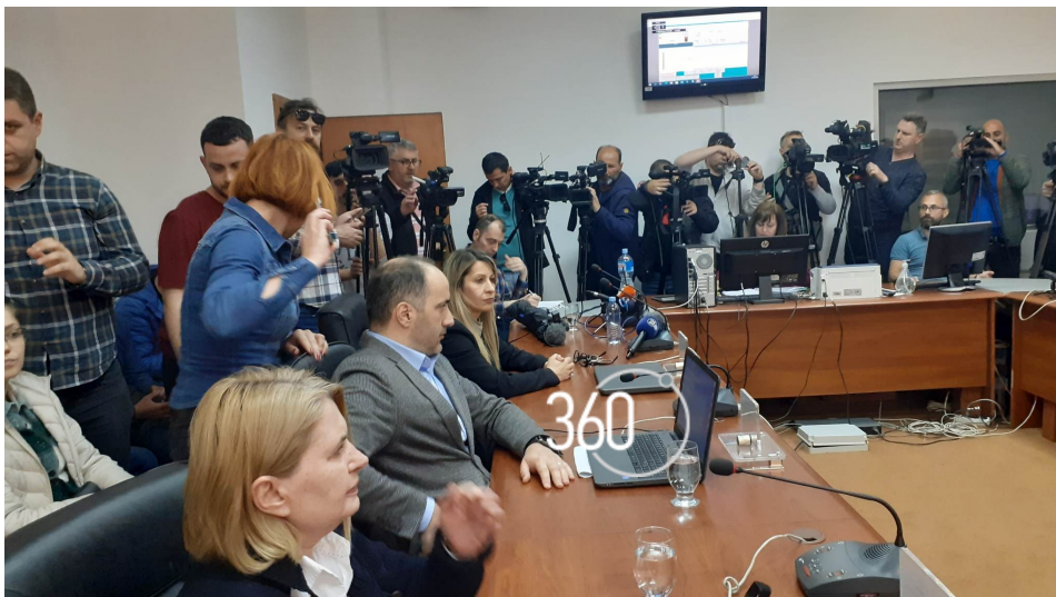
Судски совет со нова одлука: На седниците ќе може да има само новинари, но не и камери / Седница на Судски совет