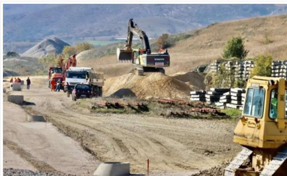
МТСП: Изградбата на коридорите обезбедува нови работни места и почитување на правата на работниците заштитени со закон (/Home/PostDetails?PostId=536065)