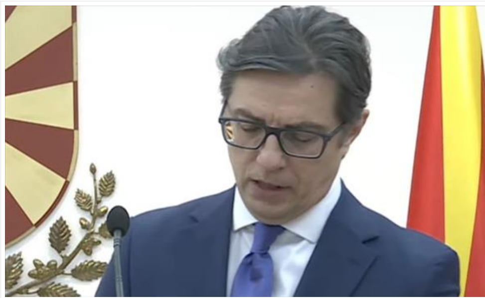
Пендаровски: Државата нема да пропадне ако ги внесеме Бугарите во Уставот (/Home/PostDetails?PostId=536076)