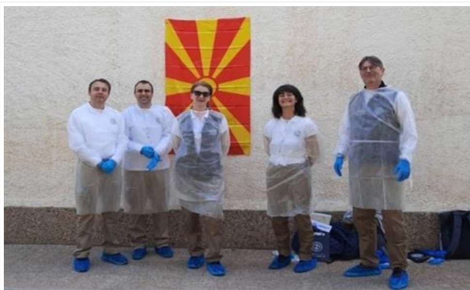
Македонски претставници на обука организирана од „Академијата за криминал против дивиот свет“ во Шпанија (/Home/PostDetails?PostId=536057)