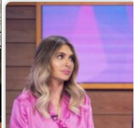
Роби Вилијамс и сопруга имаат секс, повеќе сакал