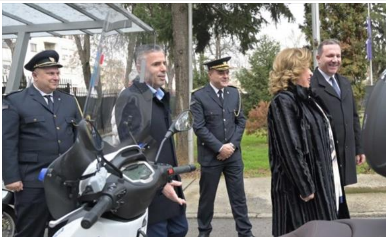
Спасовски: Предадена опрема во вредност од над 7,3 милиони денари од страна на РСБСП за потребите на сообраќајната полиција (/Home/PostDetails?PostId=520028)