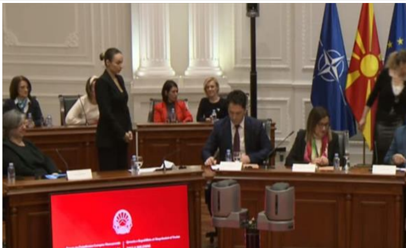
Правилник за функционална проценка на децата и младите со попреченост (/Home/PostDetails?PostId=520026)