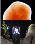
Во Охрид поставен дигитален паметен споменик со ликот на Григор Прличев август 10, 2022