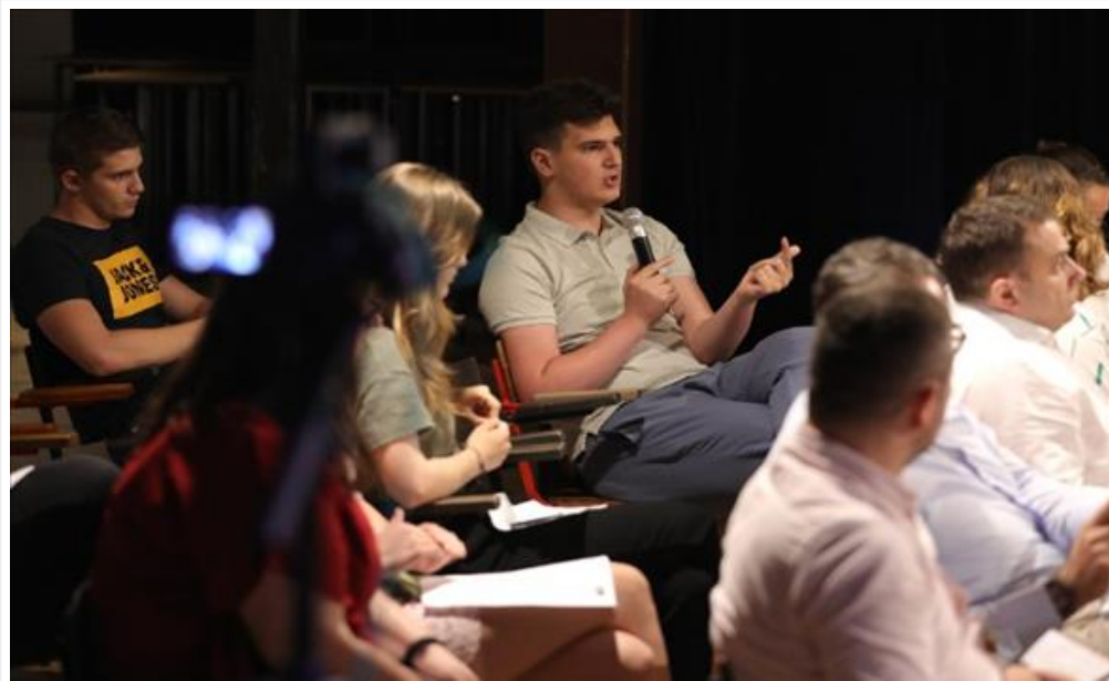
Конференција „Младите во Отворен Балкан - Шанси и перспективи за сигурен напредок во регионот“ (/Home/PostDetails?PostId=495279)