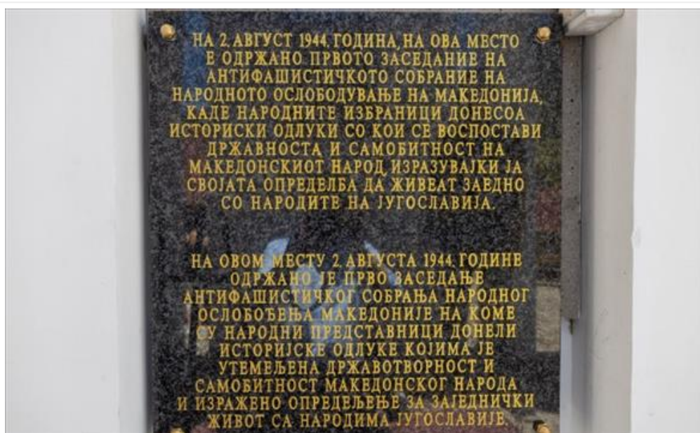
За џабе сликање и фалење: Плочата за АСНОМ во манастирот „Св. Прохор Пчињски“ за Илинден беше од времен карактер, велат од Кабинетот на Пендаровски (/Home/PostDetails?PostId=495251)