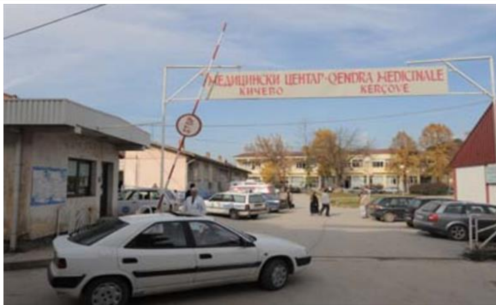
Кичевчанецот суспектен на мајмунски сипаници избегал од болницата во Кичево (/Home/PostDetails?PostId=495252)