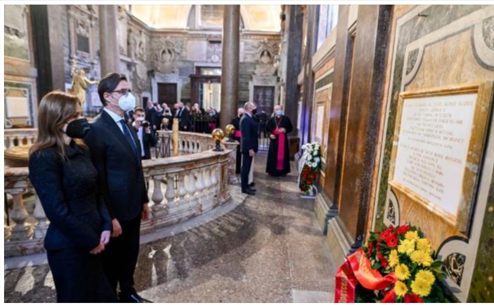
Пендаровски и Радев заеднички ги чествуваа Св. Кирил и Методиј во Рим (/Home/PostDetails?PostId=414089)