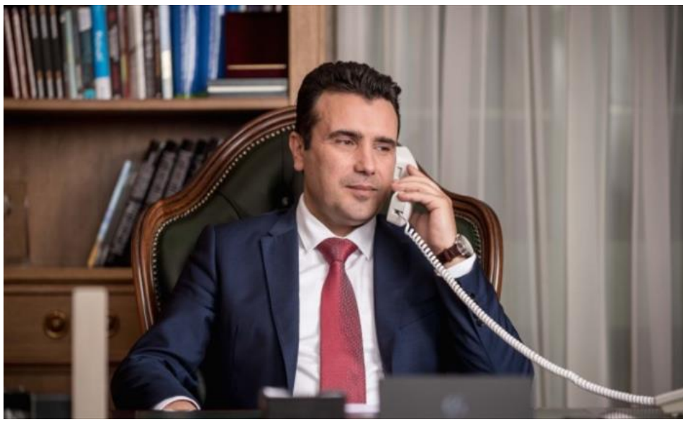
Заев оствари телефонски разговор со новиот привремен премиер на Бугарија, Стефан Јанев (/Home/PostDetails?PostId=414083)