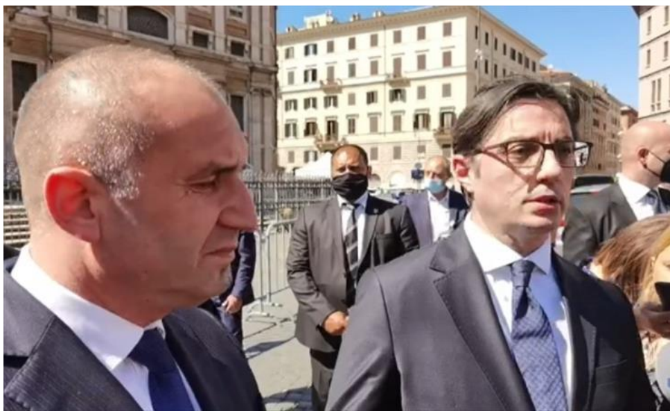
Радев до Пендаровски: Двете држави треба да работат со уште поголема доверба и дијалог, да ги решат работите заедно (/Home/PostDetails?PostId=414082)