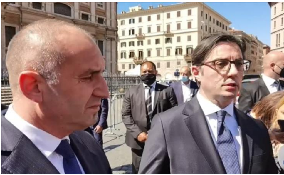
Радев до Пендаровски: Двете држави треба да работат со уште поголема доверба и дијалог, да ги решат работите заедно (/Home/PostDetails?PostId=414082)