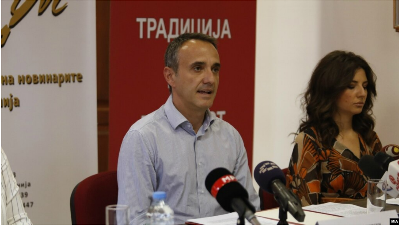
Претседателот на ЗНМ, Младен Чадиковски

Здружението на новинарите на Македонија денеска преку соопштение информира дека се придржува на повикот на Европската федерација на новинари (ЕФН) во апелот до медиумите да известуваат одговорно и да избегнуваат создавање неоправдана паника во јавноста при известувањето за коронавирусот (Ковид-19).