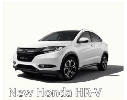
New Honda HR-V